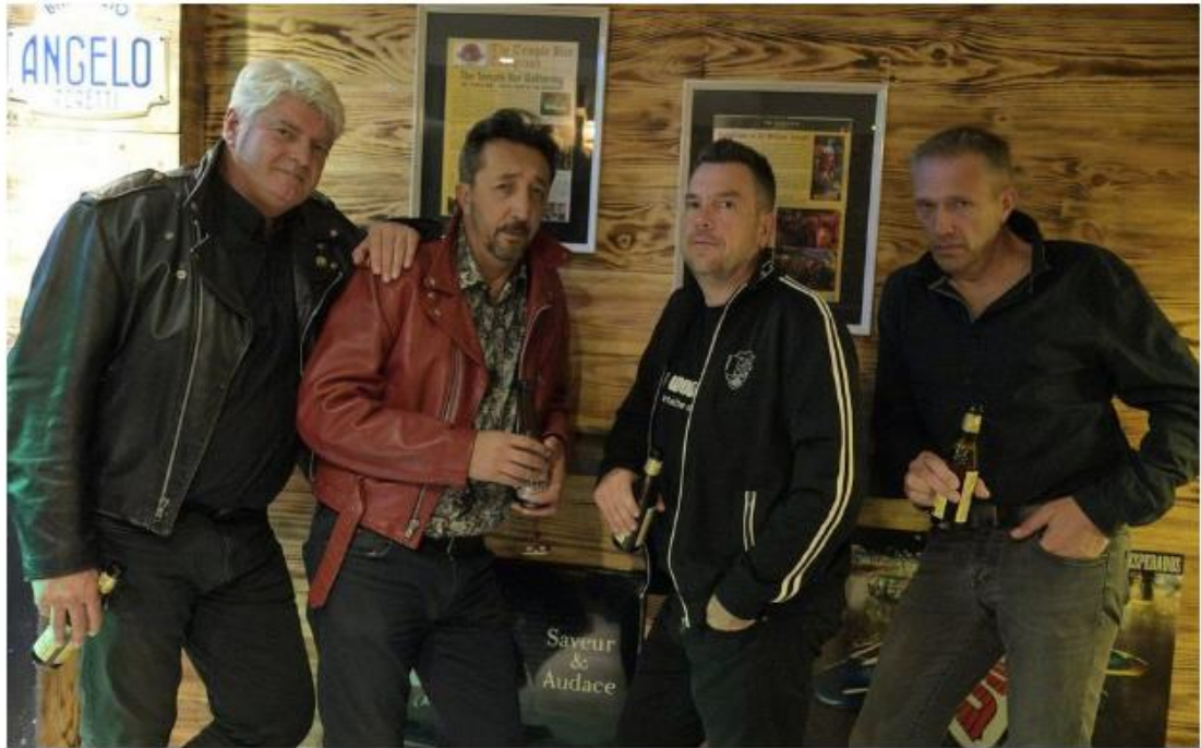
Les City Woodpeckers, défenseurs de la sainte trilogie, rock, bière et cuir.

Ce groupe français a repris le collier, après deux décennies d'absence. Un retour gagnant avec un joli album, «Some Days», qui plaira aux fans de classic rock.